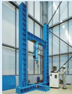
十字門型試験装置