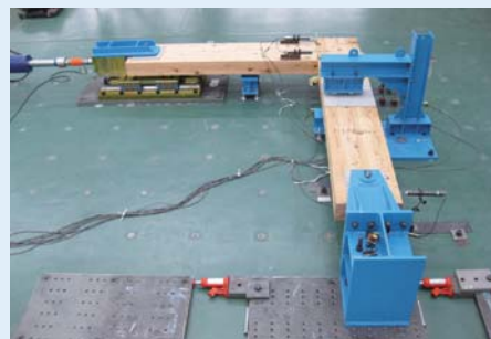
大断面接合部試験装置