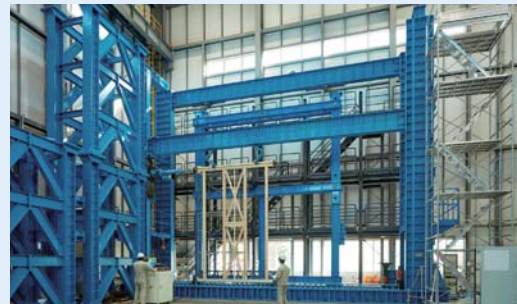
多層構面試験装置