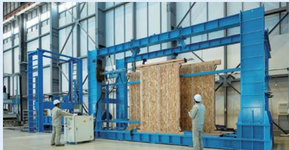
木質構造物試験装置

中央試験所では、一般的な階高の木造耐力壁、仕口、継手はもちろんのこと、より大きな高さ、幅の耐力壁や高耐力壁などの試験体に対応した試験装置もご用意しておりますので、お気軽にお問い合わせください。