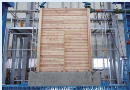
大型面内せん断試験装置

西日本試験所では、一般的な木造の面内せん断試験、仕口、継手の試験に加えて、木造ラーメンに関わる試験も実施しております。また、CLT（直交集成板）の面内せん断試験も多くの実績があり、中高層建築物に使用する大断面接合部の引張、せん断試験も対応しております。