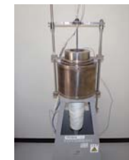
■不燃性試験装置 建築基準法で定められた防火材料(不燃材料)の性能を確認する試験に対応