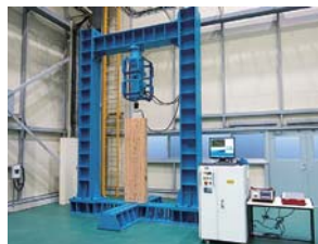
■200kN構造物試験装置 圧縮・引張・曲げ試験に対応