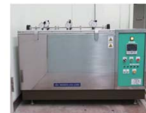
■道路用鉄鋼スラグの水浸膨張試験装置 道路用鉄鋼スラグの道路用資材としての適性を確認する試験に対応