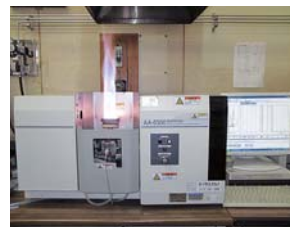
■原子吸光度計 骨材のアルカリシリカ反応性を判定する化学法に対応