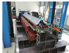
■二重折板屋根の試験装置 二重折板屋根の各種試験に対応