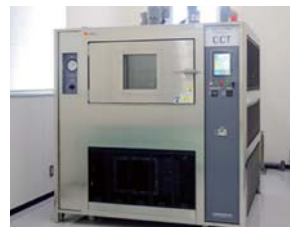
■複合サイクル試験機 塩水噴霧・乾燥・湿潤などの複合的な環境条件の設定や塩害状態を再現し、それらの各種条件を組み合わせさせたサイクル試験に対応