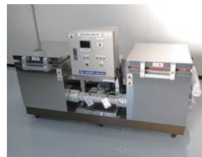
■膨張試験促進養生装置(2槽切替式) 実構造物から採取し、促進養生させたコンクリートコアの膨張率によるアルカリシリカ反応性試験に対応