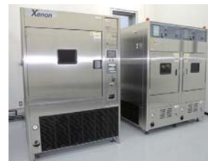
■促進耐候(光)性試験機(キセノンウェザー) 左:低温サイクル 右:2槽独立型 太陽光・温度・湿度・降雨などを再現する耐候(光)性試験に対応