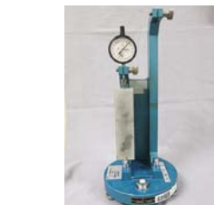
■長さ測定器 骨材のアルカリシリカ反応性を判定するモルタルバー法に対応