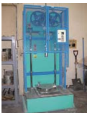
■土の突固め試験装置 路床・路盤材料・埋め戻し材料の最大乾燥密度・最適含水比・CBR試験を行うための突固めに使用