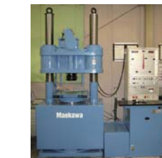
■圧縮試験機 コンクリート・モルタルの圧縮強度試験に対応