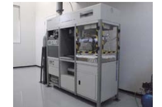
■発熱性試験装置 建築基準法で定められた防火材料(不燃材料・準不燃材料・難燃材料)やJIS・ISO規格に準ずる試験に対応