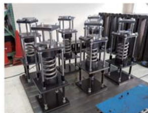
■あと施工アンカーのクリーブ試験装置 あと施工アンカーの長期引張試験が可能