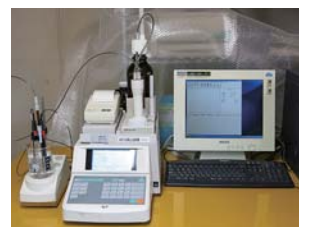
■電位差自動滴定装置 耐震診断関連として、硬化コンクリートに含まれる塩化物イオン量を測定する試験に対応