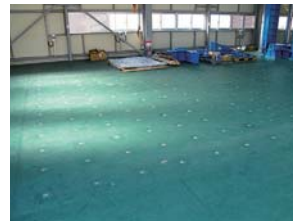
■構造反力床 ジグを設置することにより各種構造試験への対応が可能