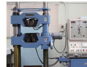
■引張試験機 鋼材の圧接継手・溶接継手・機械式継手の引張試験に対応