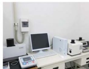
■光沢度計・測色計(左:光沢度計 右:測色計) 塗膜・塗料・金属材料などの測色や光沢の測定に対応