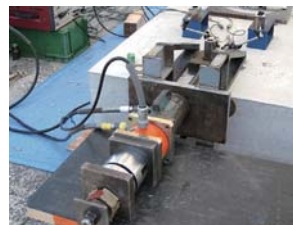
■アンカー試験装置 各種アンカーの強度試験に対応