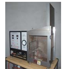
■45°燃焼性試験装置 材料の難燃性能や防炎性能を確認する試験に対応