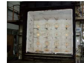
■壁炉 壁・軒裏・防火戸・区画貫通部・防火ダンパーなどの建築部材・設備に関する防耐火性能試験に対応