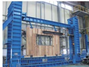
■大型面内せん断試験装置 壁・床・屋根など主要構造部位の面内せん断試験に対応