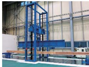
■1000kN構造物曲げ試験装置 梁部材・杭などの長支持スパン(10m)の曲げ試験に対応