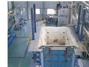
■水平炉 梁・屋根・床・区画貫通部・耐火金庫などの建築部材・設備に関する防耐火性能試験に対応