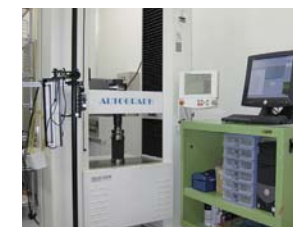
■100kNオートグラフ万能試験機 金属・プラスチックの引張・曲げ試験をはじめ、土の一軸圧縮強度試験やコーン指数試験に対応