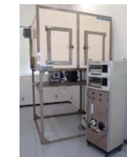
■表面試験装置 建築物の内装材料・工法の難燃性能を確認する試験に対応