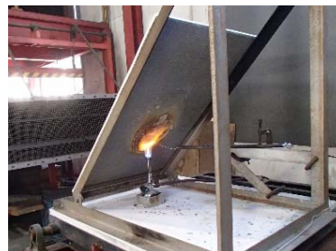
トンネル補修材料の延焼性試験